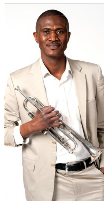
Le trompettiste Ya Tatchi se produira lors de deux concerts.