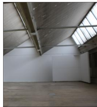
De grandes surfaces blanches ou à peine grisées rendent à la Fabrik sa vraie profondeur.

Après un passage, entre autres, à Berlin, il a trouvé à Hégenheim de quoi, en termes d'espace, réaliser un projet entamé il y a trois ans. « Il s'agit d'un challenge important pour lui qui a choisi de ne pas en faire trop », précise la commissaire.