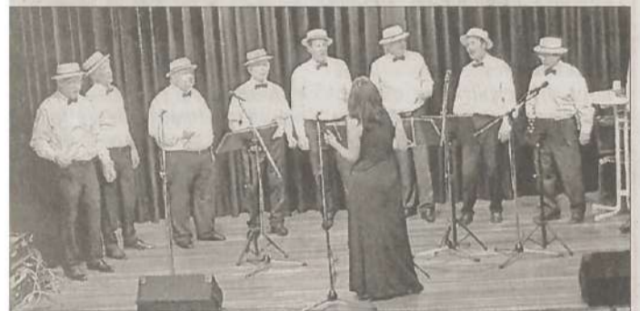
La Concordia annonce son deuxième concert de printemps.