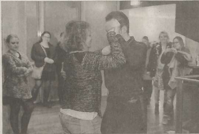
Des cours de danse étaient proposés lors de la dernière soirée entre filles. Un professeur pour toutes ces dames.

exclusivement avec des actrices ou dont la thématique s'adresse aux femmes.