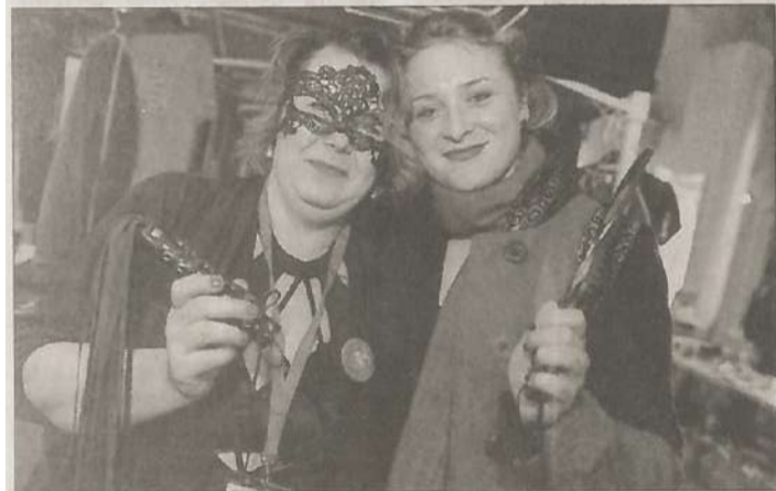
L'ambiance est toujours excellente et un tantinet coquine parfois, lors des soirées entre filles.

Mais pour que la soirée se fasse, « il faut le bon film ! » Car oui, la soirée se poursuit toujours avec la projection d'un film généralement